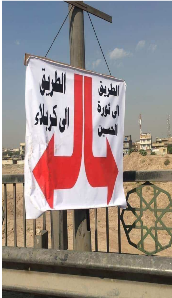
الشكل رقم (١)

المضطرد بعد عام ٢٠٠٣ دوراً سلبياً كبيراً في سلب الجمهور فاعليته السياسية والاجتماعية. وبغض النظر عن نتائجها السياسية في آخر المطاف، تبقى الميزة الأساسية لاحتجاجات تشرين هي أنها انتزعت تعريف الهوية من احتكارات النخب السلطوية وأعادته الى حيث ينبغي أن يكون: المجتمع بتنوعه وهمومه وانشغالاته واكتشافاته.