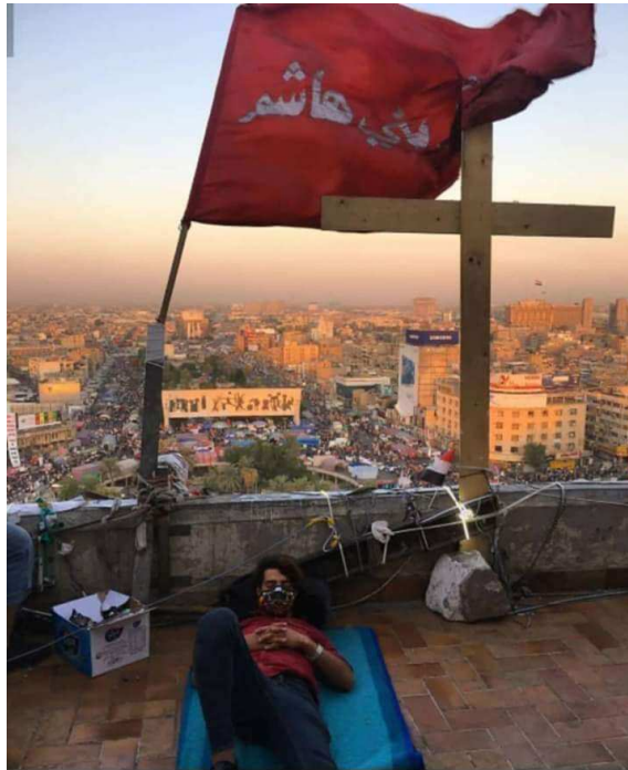
الشكل رقم (٣)